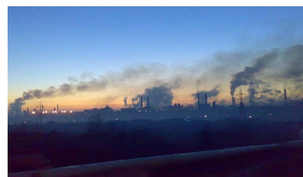
Poluarea produsă de combinatul siderurgic Galați

În aceste condiții, municipiul Galați este unul din orașele românești cele mai poluate și cu o probabilitate foarte mare ca riscurile tehnologice să crească, dacă nu se retehnologizează unitățile industriale și în special Combinatul Siderurgic, dar în ultima perioadă poluarea a scăzut deoarece unele secții din cadrul combinatului, respectiv din șantierului naval s-au închis.