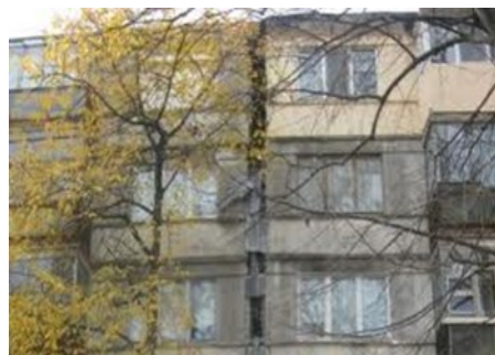
Bloc din cartierul Țiglina 1 afectat

Alunecările de teren sunt procese de deplasare ale unor mase de pământ pe versanți, în lungul unor planuri care le separă de partea stabilă a versantului, numite suprafețe de alunecare. Arealele afectate de alunecări de teren în municipiul Galați: fruntea terasei Dunării de 20 m- turn TV, fruntea