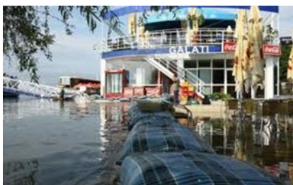
Dunărea inundând Faleza

Din punct de vedere al riscurilor tehnologice orașul Galați se încadrează în categoria localităților cu riscuri complexe generate, în principal, de activitățile industriale și de transporturi.