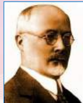
SIMION MEHEDIŢI (1868-1962)