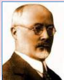
SIMION MEHEDIŢI (1868-1962)